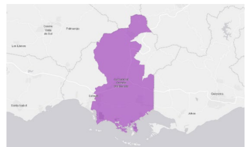
Figura 2. Un mapa del Área de incumplimiento de Guayama-Salinas, en morado.

Ubicación: Universidad Interamericana, Campus Guayama, Bo. Machete, Carr. 744, Km 1.2 Guayama, Puerto Rico 00784