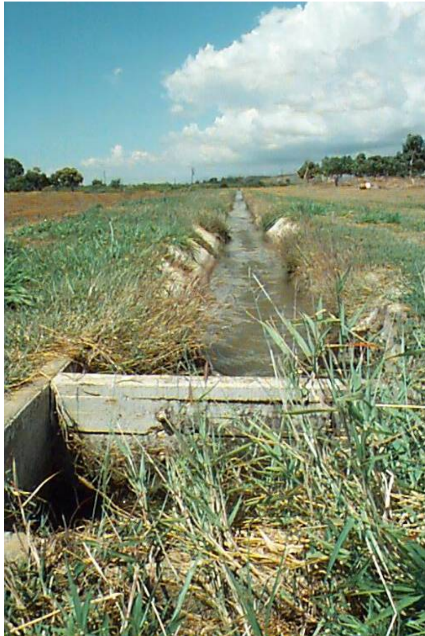
Fotografía 5-1. El uso agrícola en el sur de Puerto Rico se suple de la infraestructura de canales de riego pertenecientes al Distrito de Riego de la Costa Sur.

evapotranspiración de los bosques promueve la formación de nubes alterando la temperatura y la humedad de las masas de aire que pasan sobre ellos (Lugo y Martínó, 1996).